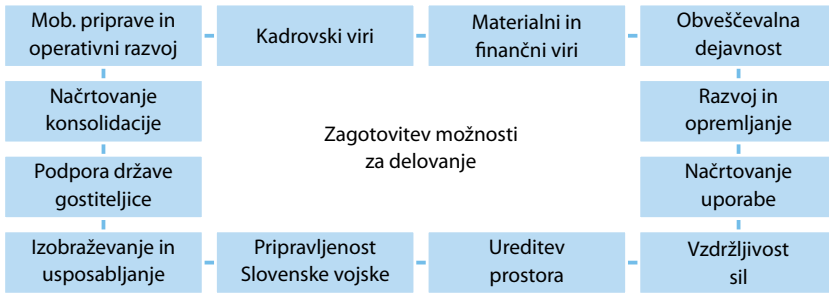
Slika 3.1 Zagotovitev možnosti za delovanje (prirejeno po Vlada Republike Slovenije, 2006, str. 30)

razvija sodobno organiziran, celovit in enovit sistem vojaškega izobraževanja in usposabljanja, ki je ob kakovostnem vodenju sposoben izvesti naloge na področju vojaškega izobraževanja in usposabljanja ter primerljiv s sistemi vojsk v zavezništvu in povezljiv z javnim izobraževalnim sistemom. Vojaška doktrina (2006) določa, da zagotovitev vojaškega izobraževanja in usposabljanja, kot tudi zagotovitev drugih dejavnosti (npr. kadrovski, materialni in finančni viri, razvoj in opremljanje, načrtovanje uporabe, vzdržljivost sil, pripravljenost Slovenske vojske idr.), predstavlja zagotovitev možnosti za delovanje Slovenske vojske in obsega dejavnosti, ki so potrebne, da se sile Slovenske vojske pravočasno, načrtno in organizirano pripravijo za uresničevanje svojega poslanstva (Vlada Republike Slovenije, 2006) (glej sliko 3.1).